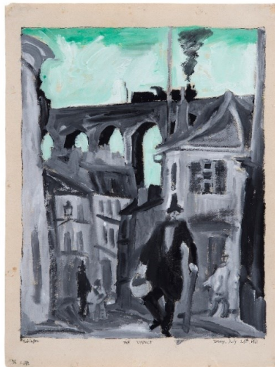
Lyonel Feininger, Das Viadukt, 1911, Tusche, Gouache, 32,8 x 24,2 cm, Kulturstiftung Sachsen-Anhalt, Lyonel-Feininger-Galerie, Stiftung Lyonel-Feininger-Sammlung Armin Rühl, © VG Bild-Kunst, Bonn 2022, Foto: Christoph Münstermann